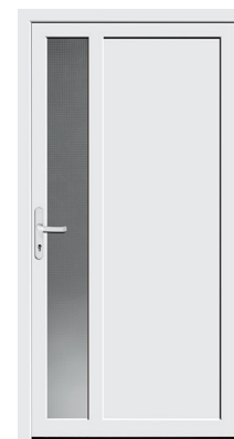
Nebeneingangstür Protect 05*

* Aufpreis für Ornamentglas bei Protect 05 beachten