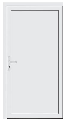
Nebeneingangstür Protect 04