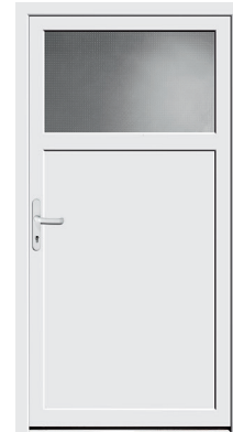
Nebeneingangstür Protect 02