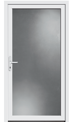
Nebeneingangstür Protect 03