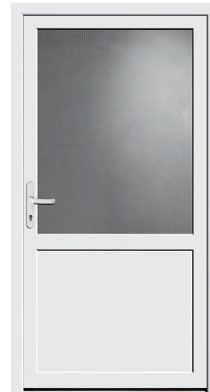
Nebeneingangstür Protect 01